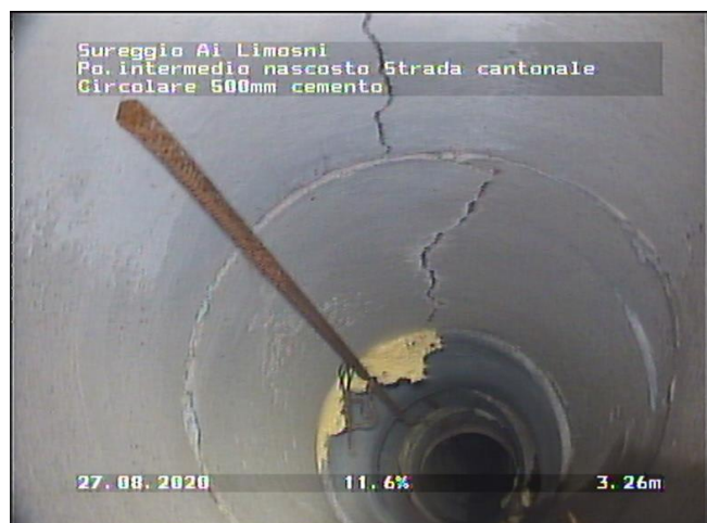
Foto dello stato della canalizzazione acque meteoriche, lungo il mapp.829.

Visti i diversi cantieri privati attivi nella zona, il Municipio ha deciso di effettuare una valutazione preliminare del riale intubato che attraversa gli attuali mappali 829, 1147 e 1148 ubicati nella sezione di Lugaggia. L'intento è quello di eseguire eventuali interventi di manutenzione su questo riale senza dover operare sulle proprietà private in un secondo momento e quindi con oneri nettamente maggiori. Dall'analisi, basata sulla documentazione d'archivio e su di un'apposita indagine televisiva, è emerso che la struttura è fortemente danneggiata, soprattutto nella parte a valle. Inoltre, si è potuto scoprire come la tratta in esame parte da una camera non accessibile e dalla geometria anomala, posta sotto il campo stradale di Via ai Limòsni, verosimilmente modificata negli anni per permettere il passaggio di altre infrastrutture.